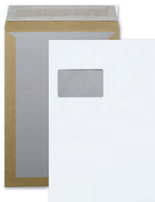
Versandtaschen mit Papprückwand