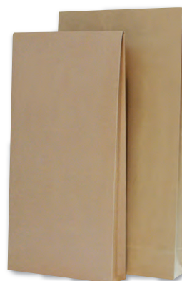
Versandtaschen mit Stehboden