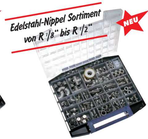
Edelstahl-Nippel Sortiment von R 1/8 bis R 1/2