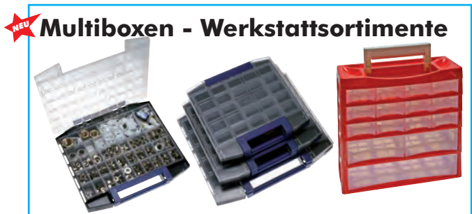
NEU Multiboxen - Werkstattsortimente