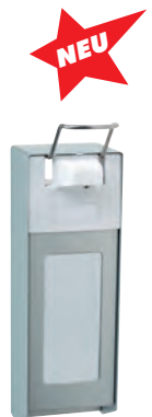
Typ SPENEURO 2