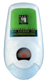
für 2 ltr.