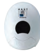
für 1 ltr.